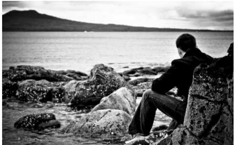
Kein Ort nirgendwo. Depressionen sind etwas anderes als Melancholie.